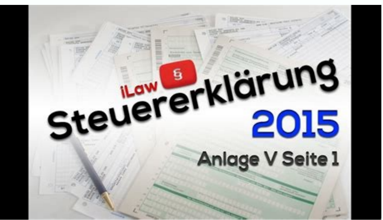
Formular steuererklärung 2015 anlage vorsorgeaufwand.